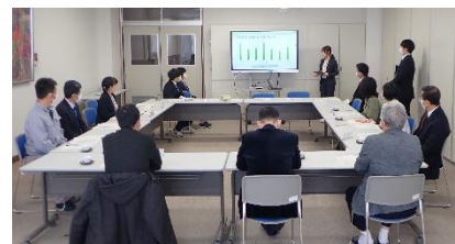
【学校保健委員会の様子】