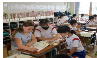
【リッチモンド小学校との交流】

小学校でも、保健委員会で手洗いの呼びかけについて話し合いをしました。学校の児童が健康で楽しく学習することができるように、福野小学校のみんなで声をかけ合い、予防に努めていきたいと思えます。ぜひ、ご家庭でもお子さんに声かけをよろしく願います。